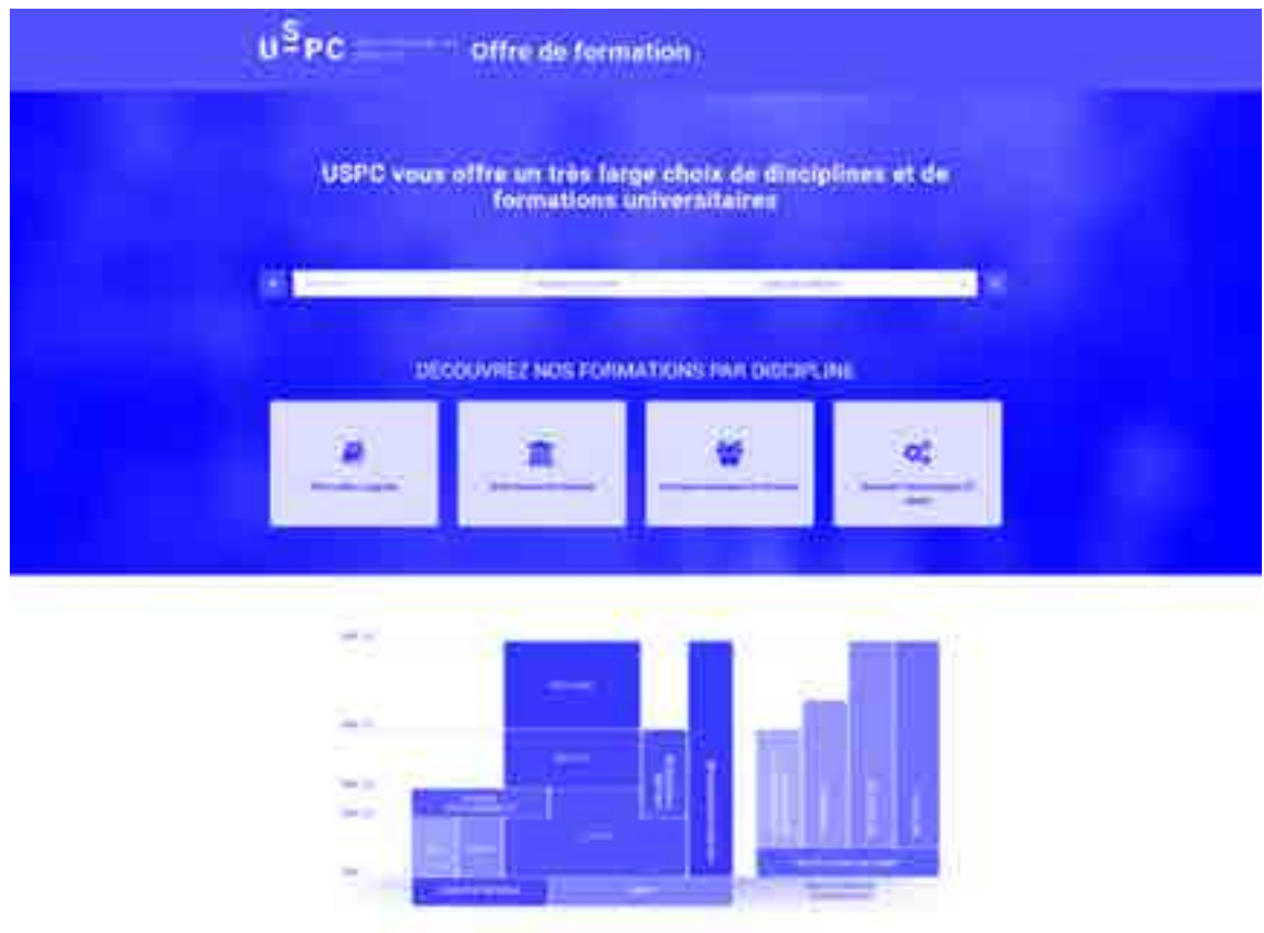
Figure 4. Offre de formation de USPC : http://odf.uspc.fr/